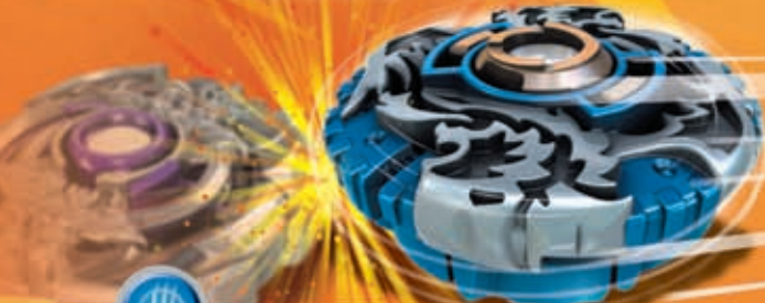
ASLEON™ TEAM PREDATOR™